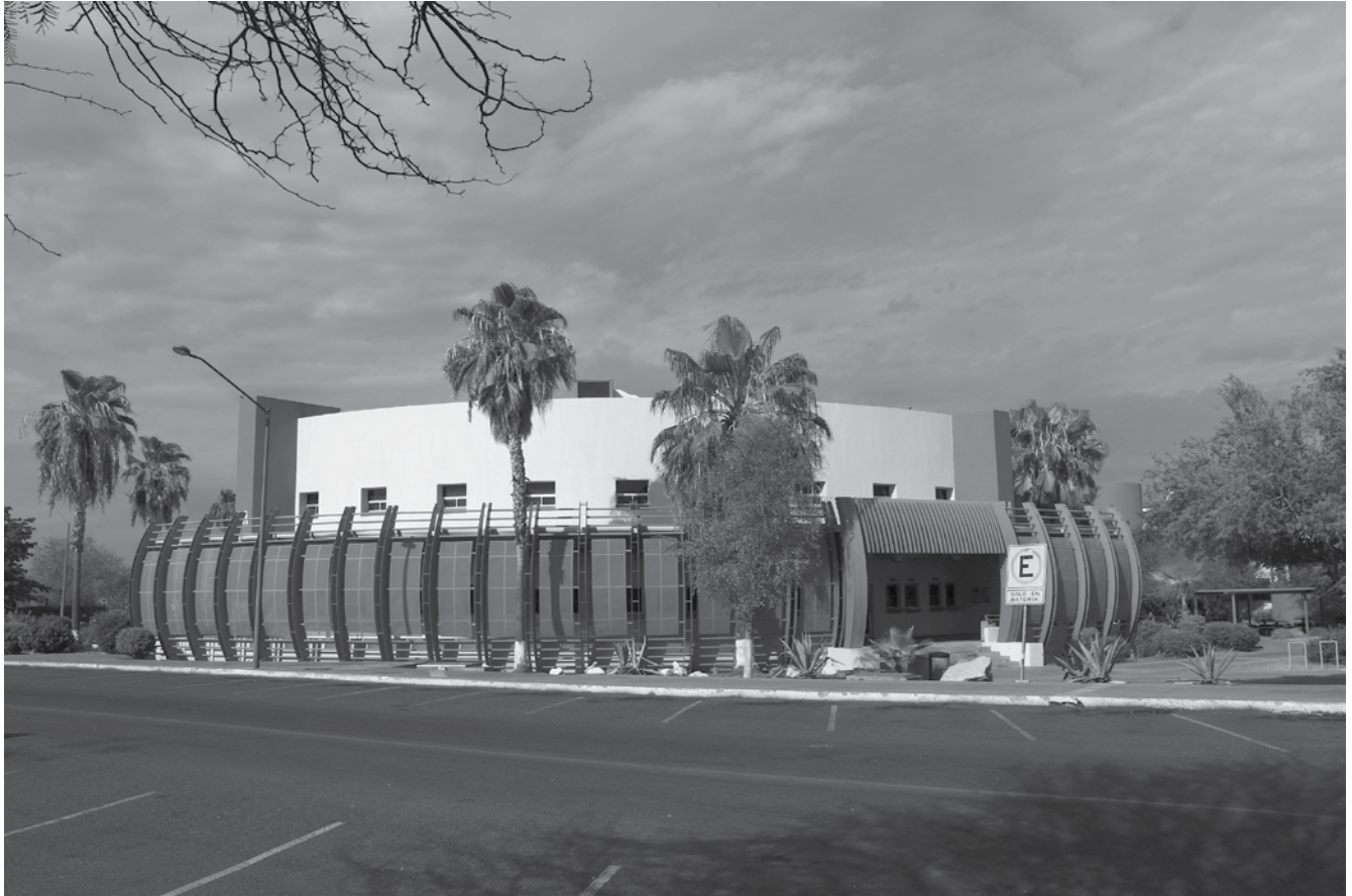
Edificio de Servicios Estudiantiles de la Universidad de Sonora.