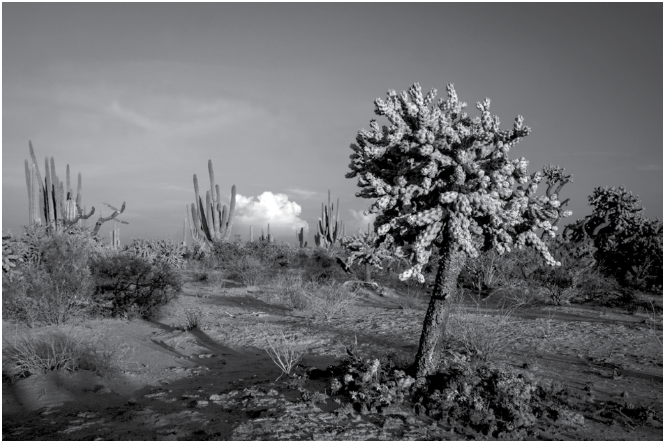
Cactáceas de Sonora.