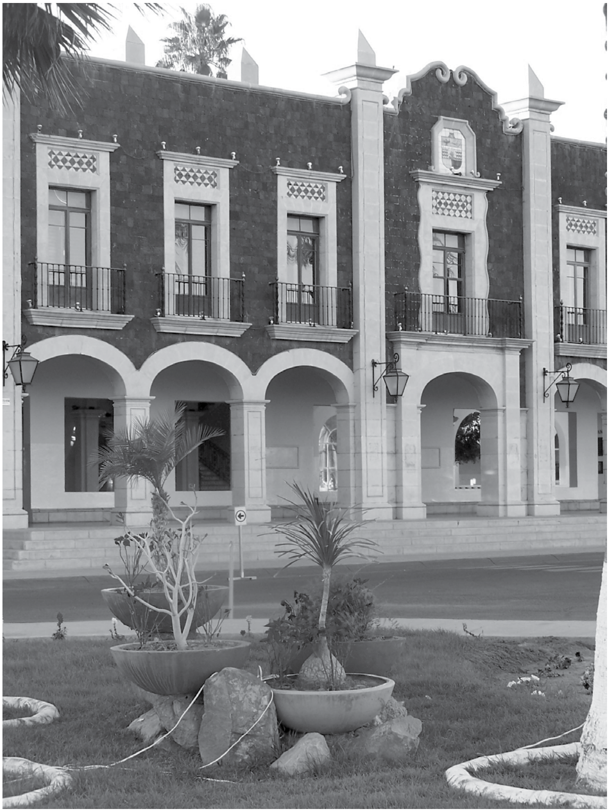
Edificio de Rectoría, Universidad de Sonora, Campus Hermosillo.