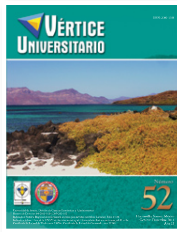
Isla Coronado, Guaymas, Sonora.