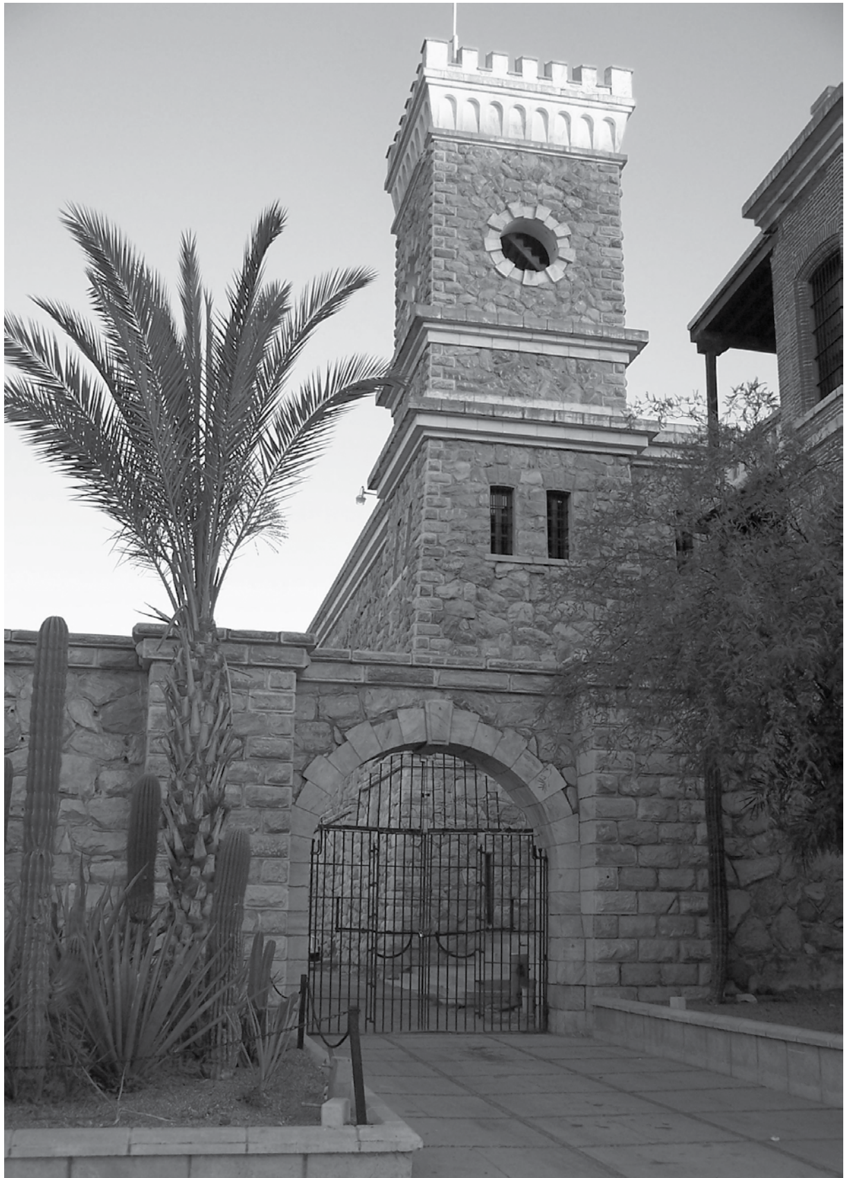
Museo de Sonora. Hermosillo, Sonora, México.