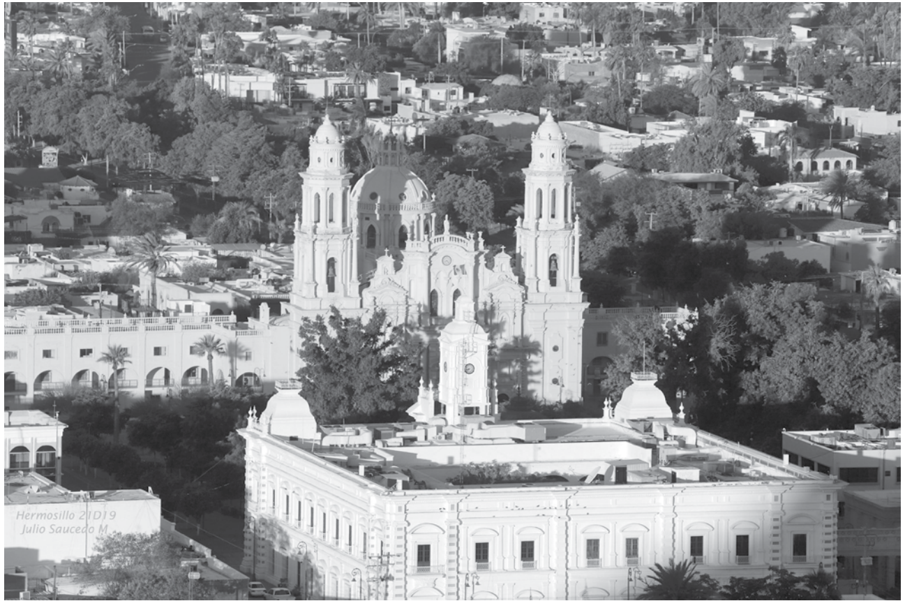
La ciudad del Sol.