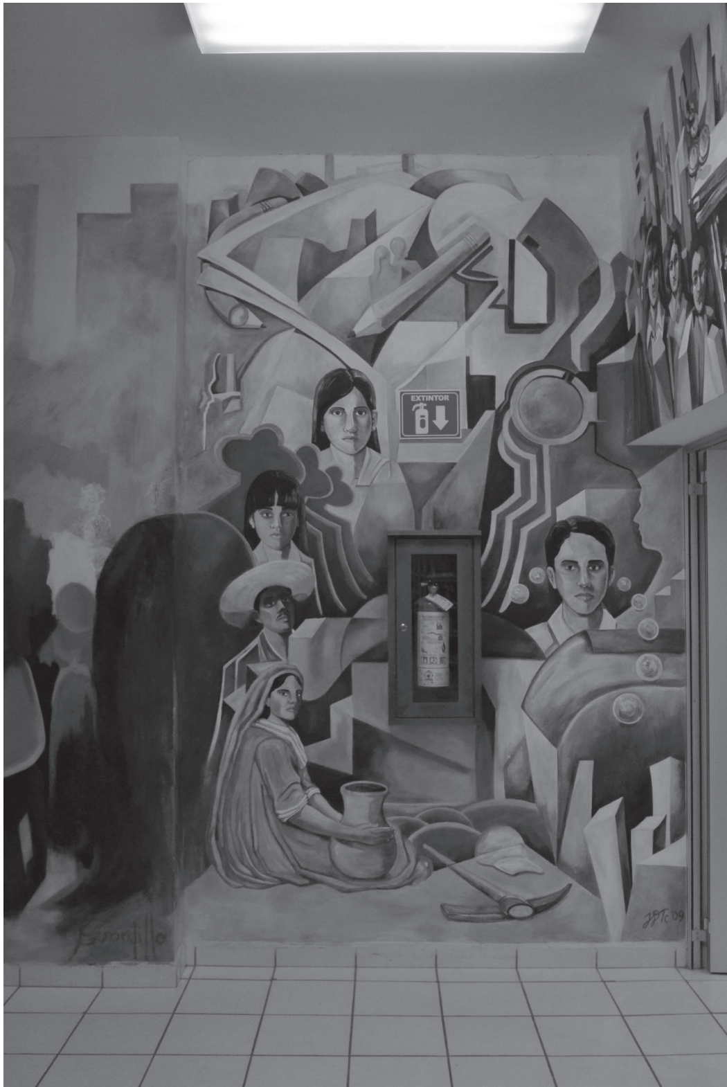
“El Socialismo Cultural”, mural externo de la Biblioteca de la División de Ciencias Sociales, Universidad de Sonora.