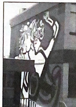
Imagen de portada: Mural del Departamento de Economía de la Universidad de Sonora