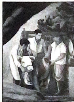
Imagen de portada: Mural del Departamento de Agricultura Universidad de Sonora