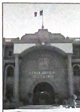
Imagen de portada: Frente del edificio del Poder Judicial del Estado