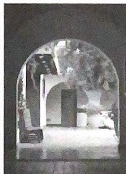
Imagen de portada: Edificio de Letras, Universidad de Sonora.