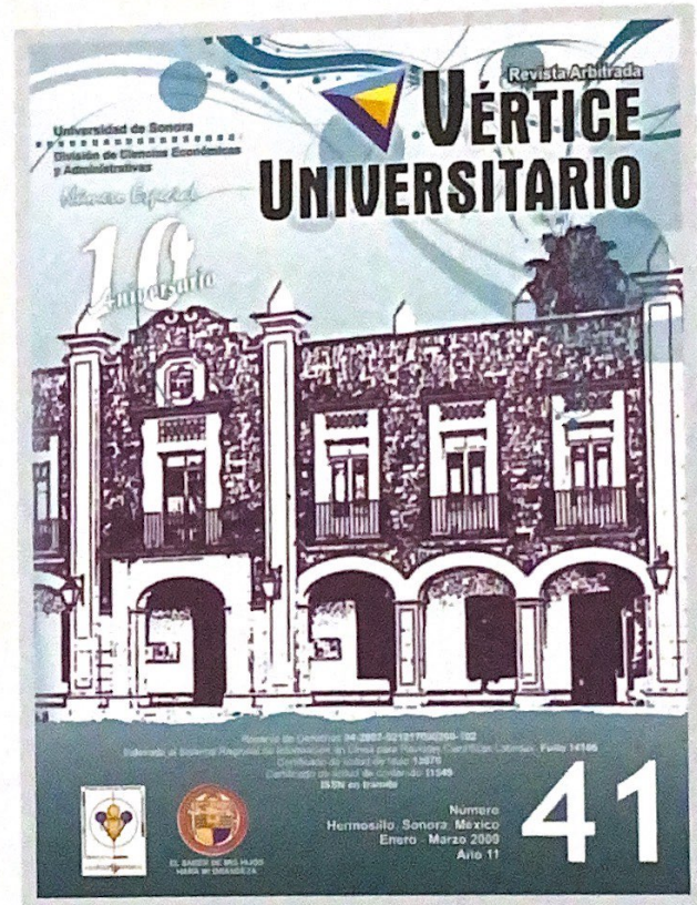
Edificio de Rectoría Universidad de Sonora, Hermosillo, México.