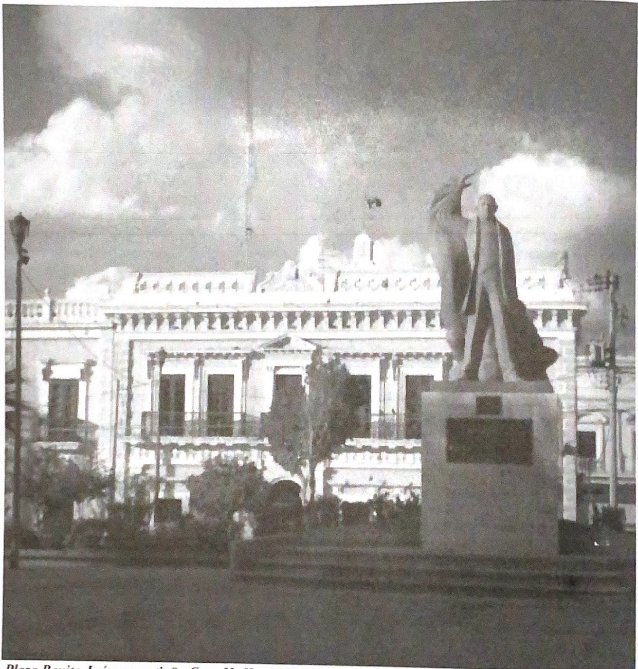
Plaza Benito Juárez y antigua Casa Hoffer en Hermosillo, Sonora.