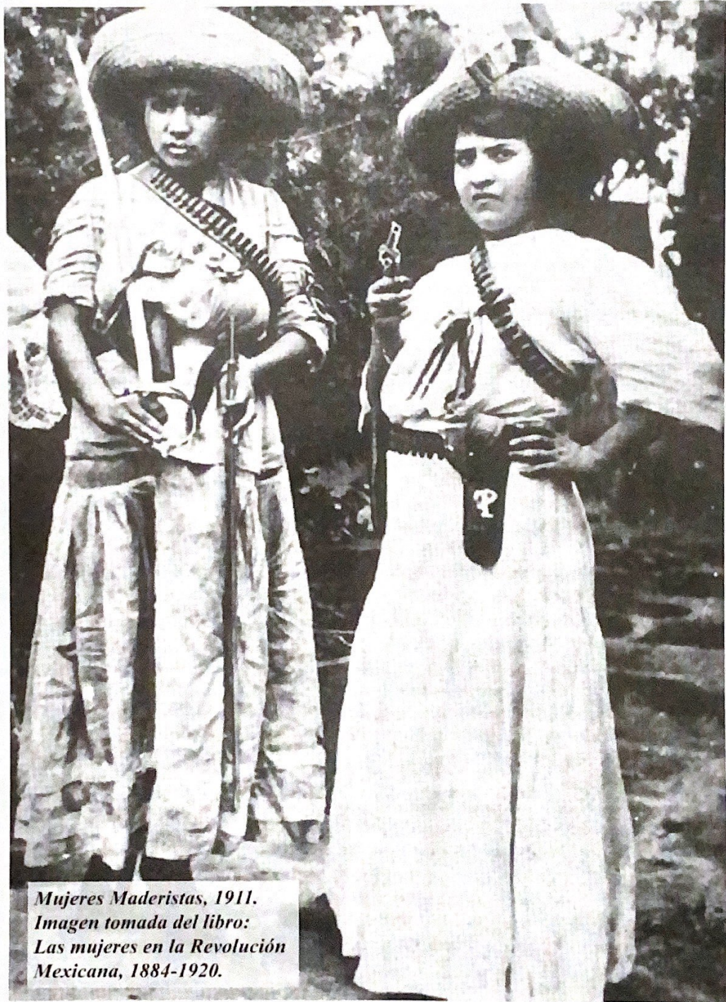
Mujeres Maderistas, 1911. Imagen tomada del libro: Las mujeres en la Revolución Mexicana, 1884-1920.