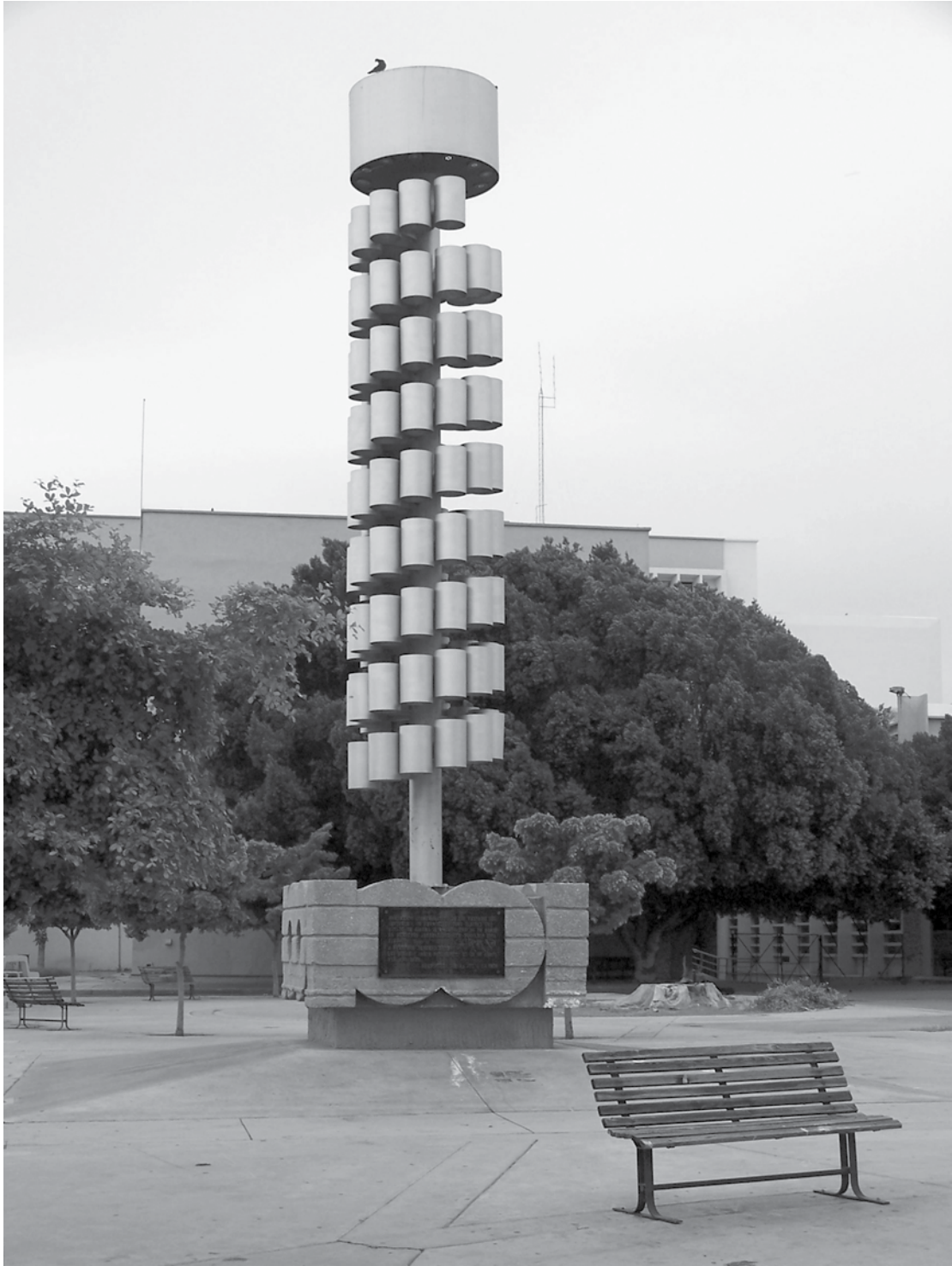
Plaza de los cien años, Hermosillo, Sonora.